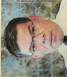
Saya kena teliti berapa banyak aduan diterima mengenai status halal produk import berkenaan sebelum mengambil tindakan selanjutnya.

Di Shah Alam, Kementerian Perdagangan Dalam Negeri dan Hal Ehwal Pengguna (KPDNHEP) akan meneliti aduan berhubung status logo halal produk import sebelum mengambil tindakan selanjutnya.