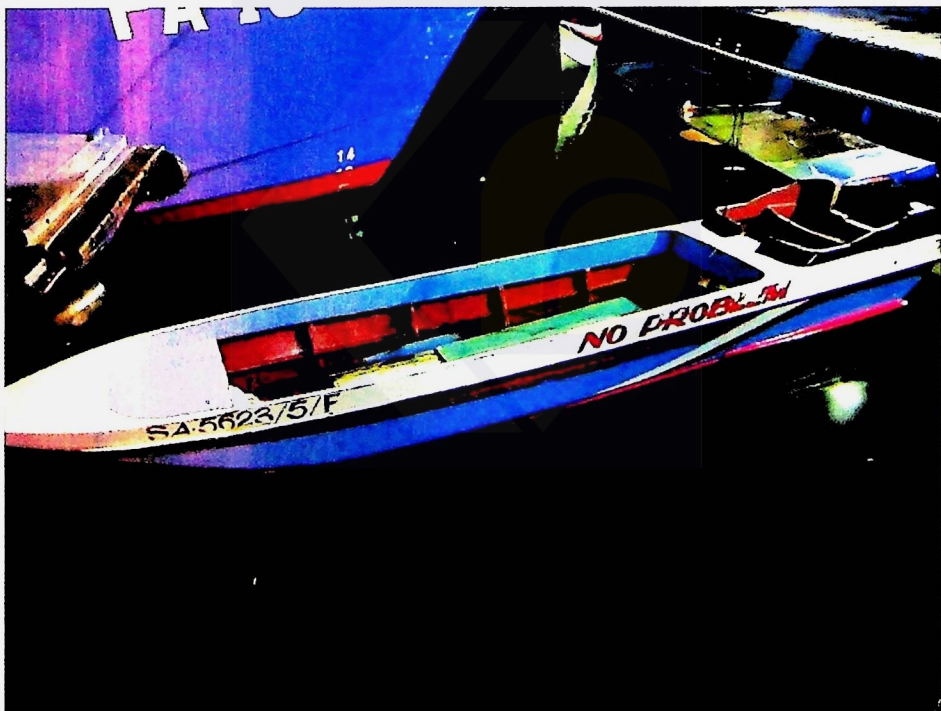
Katanya, kes disiasat mengikut Seksyen 21 Akta Kawalan Bekalan 1961.