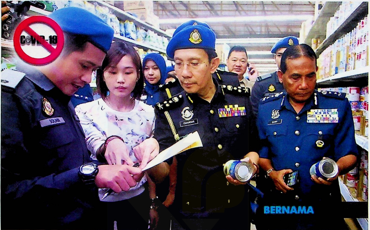
Datuk Iskandar Halim Sulaiman (tengah), Pengarah Penguatkuasa Kementerian Perdagangan Dalam Negeri dan Hal Ehwal Pengguna (KPDNHEP)

Dilaporkan, bekalan penutup mulut dan hidung di pasaran sehingga 8 April meningkat kepada 25 peratus berbanding antara tiga hingga empat peratus sebelum ini. Bagaimanapun, peningkatan bekalan tersebut masih belum mencukupi untuk memenuhi permintaan.