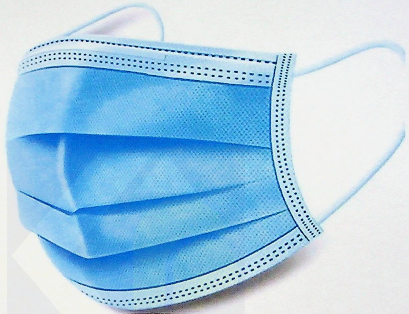
Penutup mulut dan hidung. – Gambar hiasan

Sekotak penutup mulut dan hidung yang mengandungi 50 keping, dijual pada harga RM70. Apabila Nurul Ain menerima barangan yang dibeli di Facebook, dia mendapati ada hanya lima (5) keping penutup mulut dan hidung di dalam kotak berkenaan. Beliau cuba menelefon balik penjual tetapi usahanya gagal.