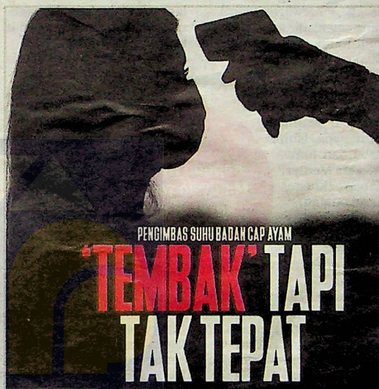
▶ LAPORAN Harian Metro, kelmarin.

laporkan di media arus perdana mengenai penjualan dan penggunaan alat pengimbas digital produk murahan itu, KPDNHEP tidak menerima sebarang laporan mengenainya," katanya.