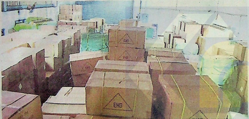
PREMIS memproses kasut dan selipar tiruan pelbagai jenama di Kawasan Perindustrian Menglembu dan Kawasan Perindustrian Chandan Raya diserbu KPDNHEP Putrajaya.

"Premis terbabit dijadikan tempat mengilang dan penyimpanan pelbagai jenis selipar serta ka-