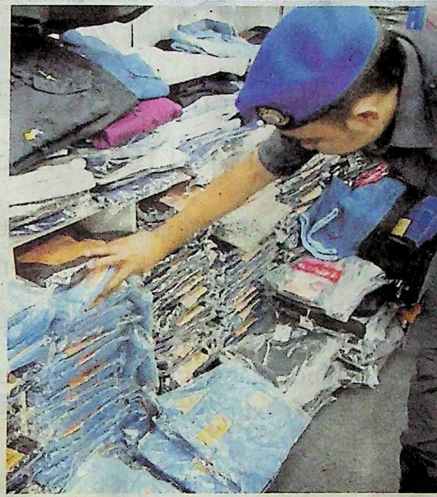
ANGGOTA KPDNHEP merampas pakaian tiruan berjenama yang dijual di Kenanga Wholesale City.