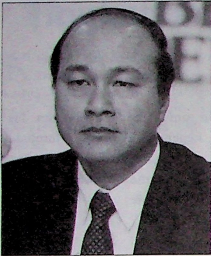
Dato' Lee Lam Thye

Keputusan Kerajaan baru-baru ini untuk menghentikan pembinaan rumah kos rendah RM 25,000 di bawah Rancangan Malaysia Ketujuh (RM-7) menghairankan saya. Saya sentiasa mempunyai pandangan bahawa penyediaan rumah kos rendah bagi keperluan perumahan bagi rakyat miskin dan golongan berpendapatan rendah adalah merupakan tanggungjawab sosial Kerajaan.