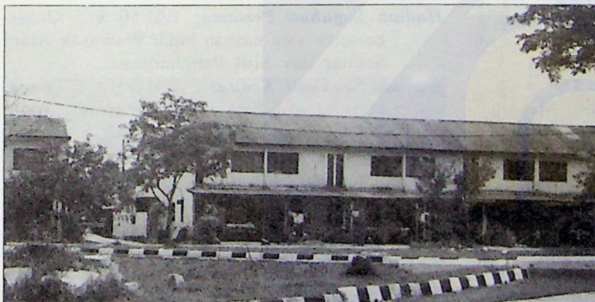
Rumah kos rendah perlu diberikan hanya kepada mereka yang miskin dan memerlukan.

Sehubungan itu, saya merasakan perlu bagi Kerajaan mempertimbangkan komen daripada pihak Persatuan Pemaju Perumahan baru-baru ini yang menggesa sokongan penuh dan kerjasama daripada pihak Kerajaan dan pihak berkenaan yang terbabit dalam industri perumahan.