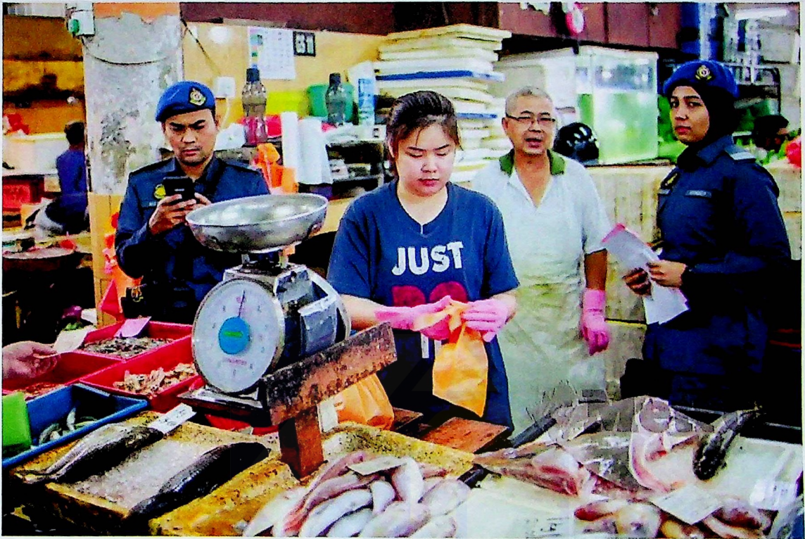
PENGUATKUASA KPDNHEP Cawangan Kajang membuat pemeriksaan harga ketika tinjauan Skim Harga Maksimum Musim Perayaan di Pasar Kajang.

Sri Ayu Kartika Amri kartika@hmetro.com.my