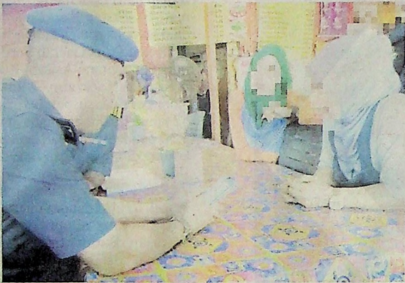
Peniaga wanita (kanan) yang disiasat KPDNHEP sebelum dikenakan kompaun kerana gagal pameran tanda harga terhadap tomyam udang yang dijual dengan harga RM30 di Pantai Cahaya Bulan kelmarih.