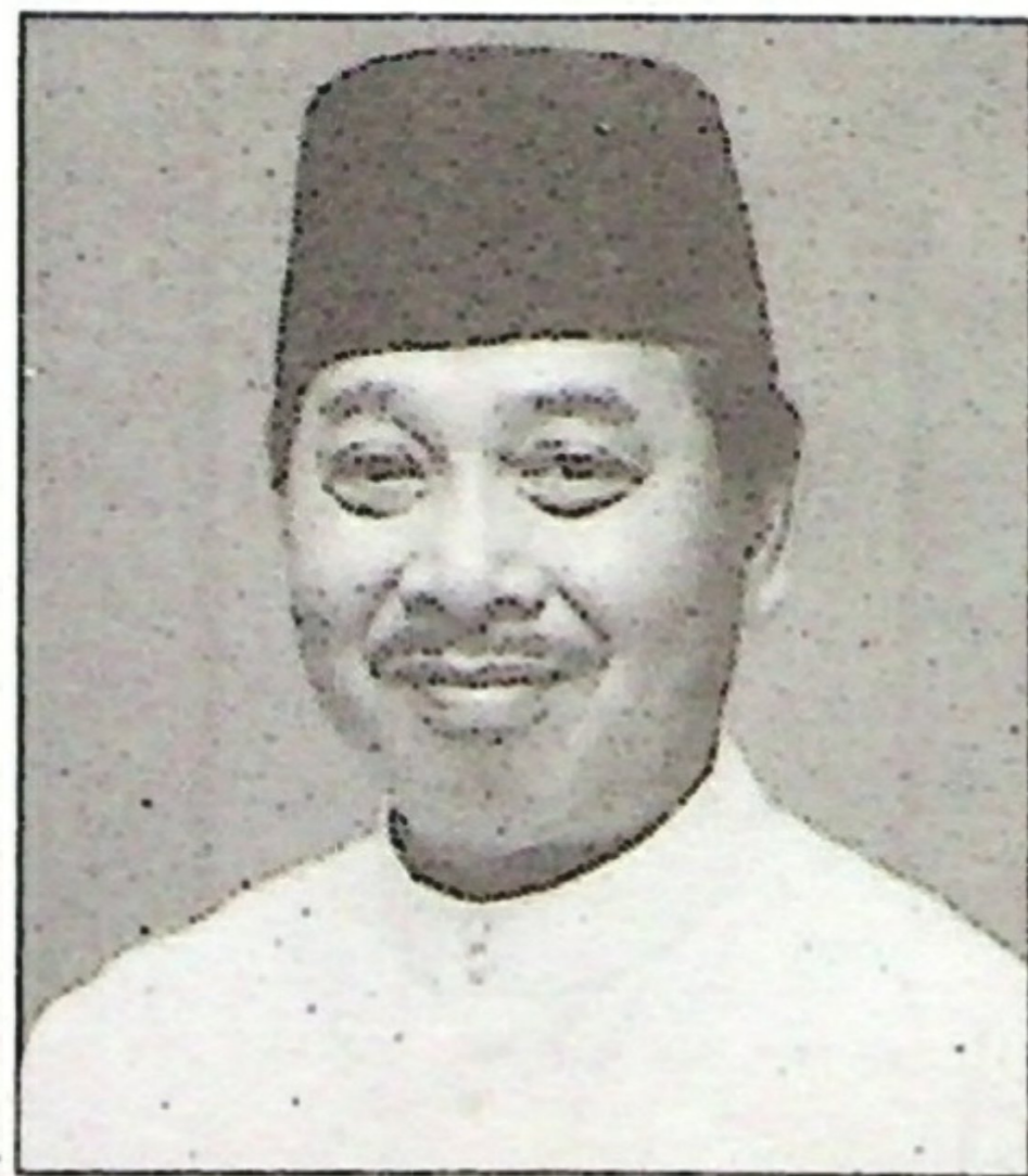
YB. Dato' Seri Megat Junid Megat Ayob

Menurut Menteri Perdagangan Dalam Negeri dan Hal Ehwal Pengguna, YB. Dato' Seri Megat Junid Megat Ayob, "mereka [penjual] ini biasanya mengambil barang-barang yang tidak laris di