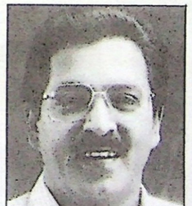
YB. Dato' S. Subramaniam

Menurut Timbalan Menteri Perdagangan Dalam Negeri dan Hal Ehwal Pengguna, YB. Dato' S. Subramaniam, Persekutuan Pengilang-pengilang Malaysia (FMM) telah bersetuju memaparkan harga runcit yang disyorkan di atas barang buatan Malaysia yang hanya menggunakan kandungan tempatan. Langkah tersebut bertujuan mengelakkan amalan mencatut oleh peruncit dan peniaga.