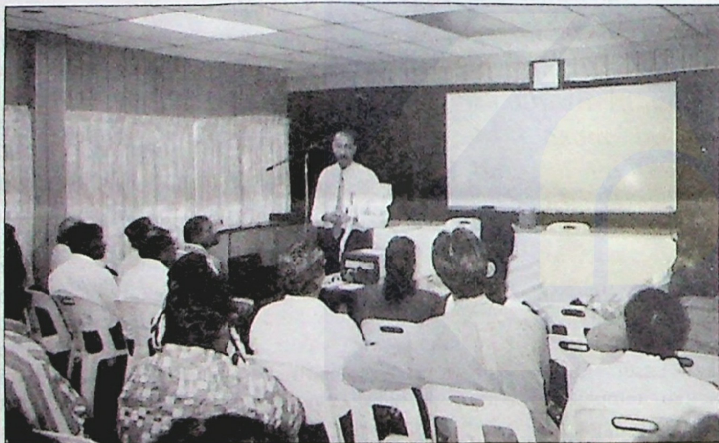
Sebahagian daripada para peserta dalam salah satu sesi yang diadakan.