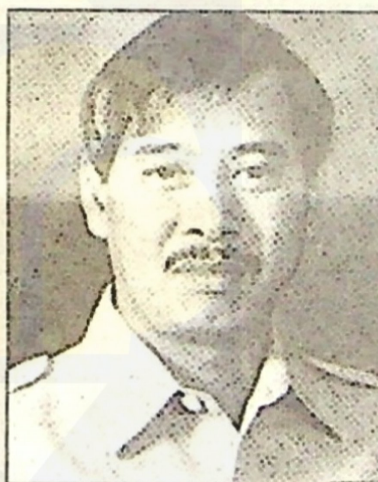
YB. Datuk Seri Megat Junid Megat Ayob

Sebenarnya, sikap berjimat-cermat dan belanja secara berhemat adalah tabiat baik yang perlu diamalkan setiap waktu, tidak kira keadaan ekonomi negara. Semua agama menyeru umatnya mengelakkan pembaziran dan bersikap sederhana dalam segala aspek kehidupan.