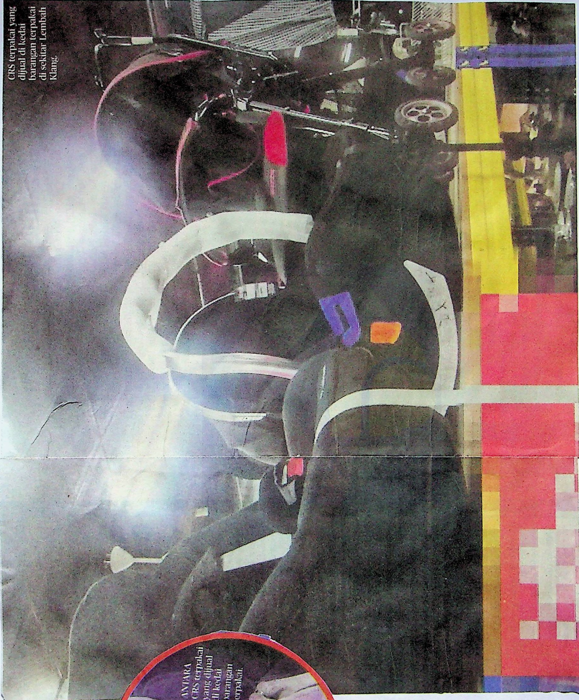
CRS terpakai yang dijual di kedai barangan terpakai di sekitar Lembah Klang.