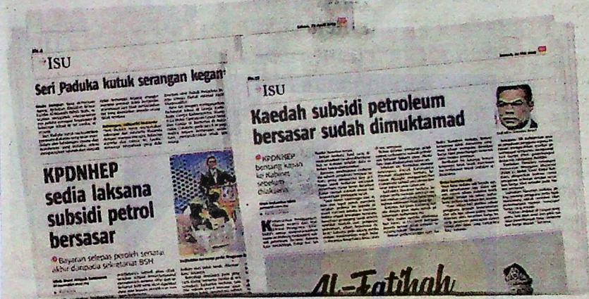
Keratan akhbar BH pada 23 April dan 24 Mei lalu.

2 juta penerima BSH miliki kenderaan berdaftar layak dapat bantuan