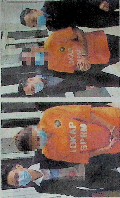
Dua pengarah syarikat antara empat yang ditahan SPRM direman di Mahkamah Majistret Putrajaya, semalam.

BH difahamkan, berdasarkan semakan dengan KPDNHEP, sindiket itu diberikan kuota pembekalan minyak masak sebanyak 1,000 tan sebulan dan sepatutnya, mereka perlu memproses dan membungkus semula minyak masak yang diberikan kepada bung-