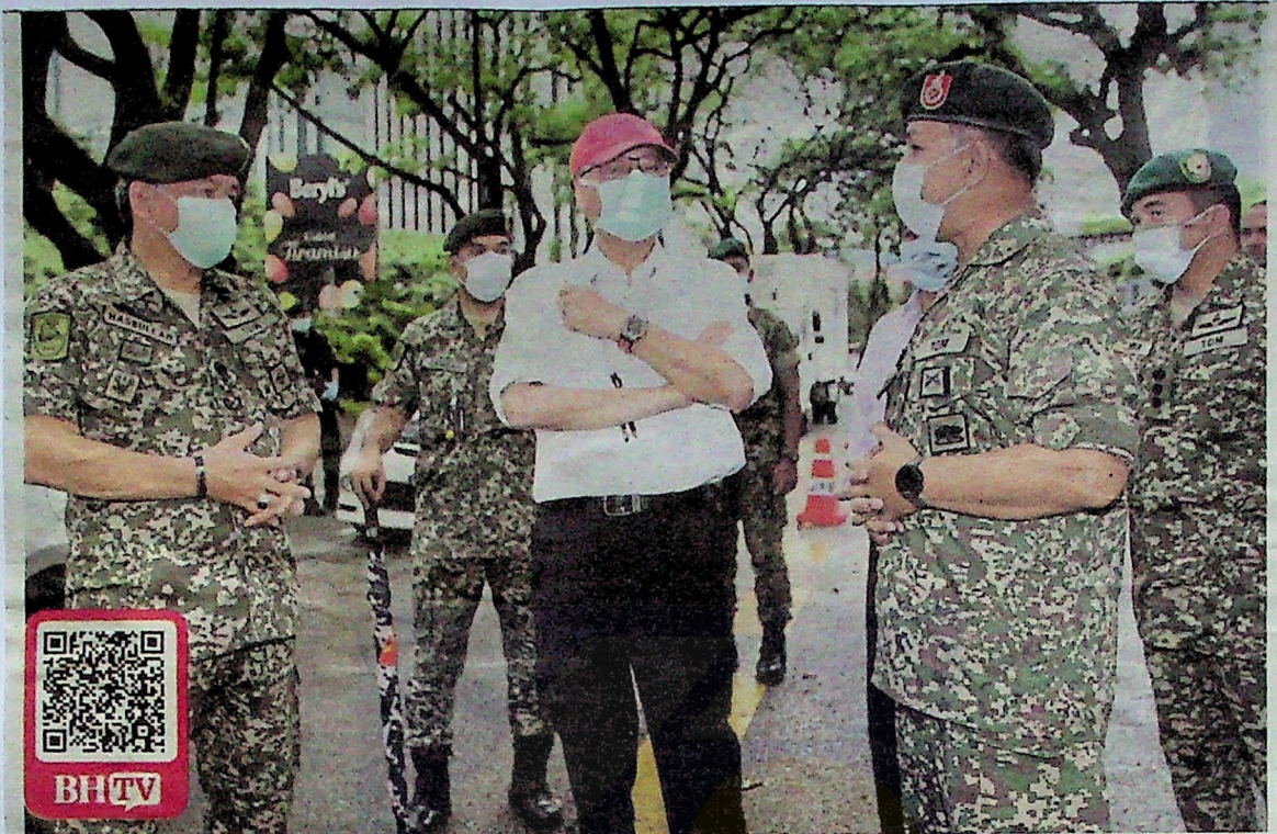
Ismail Sabri meninjau penugasan anggota polis dan tentera yang membuat pemeriksaan kenderaan di Jalan Ampang, Kuala Lumpur, semalam.