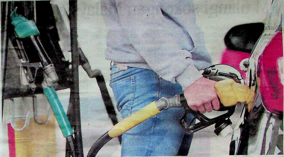
Harga RON95 akan dinaikkan secara berperingkat antara satu sen atau dua sen bermula Januari ini. (Foto hiasan)

Hal Ehwal Pengguna, Datuk Seri Saifuddin Nasution Ismail mengumumkan PSP bertujuan meringankan beban kira-kira 2.9 juta penerima Bantuan Sara Hidup (BSH) di Semenanjung yang memiliki kenderaan atas nama sendiri dan cukai jalan yang sah.