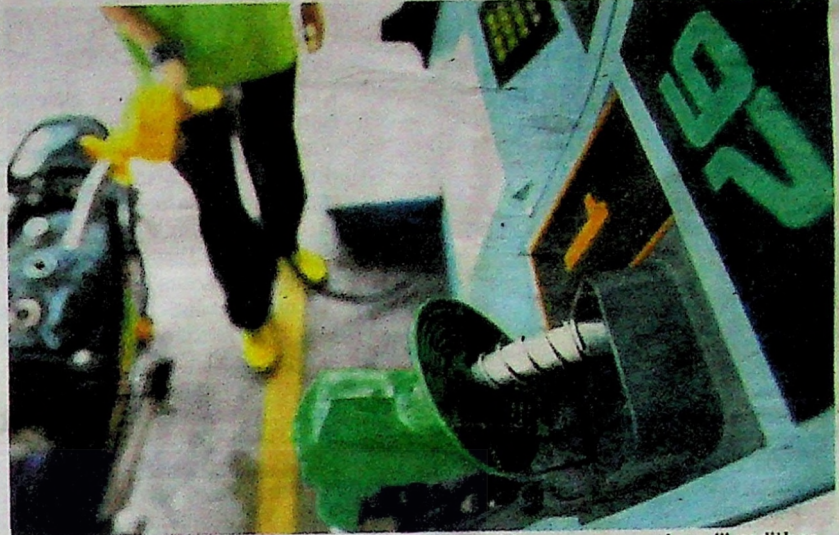
PENERIMA BSH dijangka menerima subsidi petrol bersasar yang akan dikreditkan ke dalam akaun bank masing-masing selepas dilaksanakan kelak. – Gambar hiasan

Saifuddin dilaporkan berkata, beliau mengakui keputusan itu