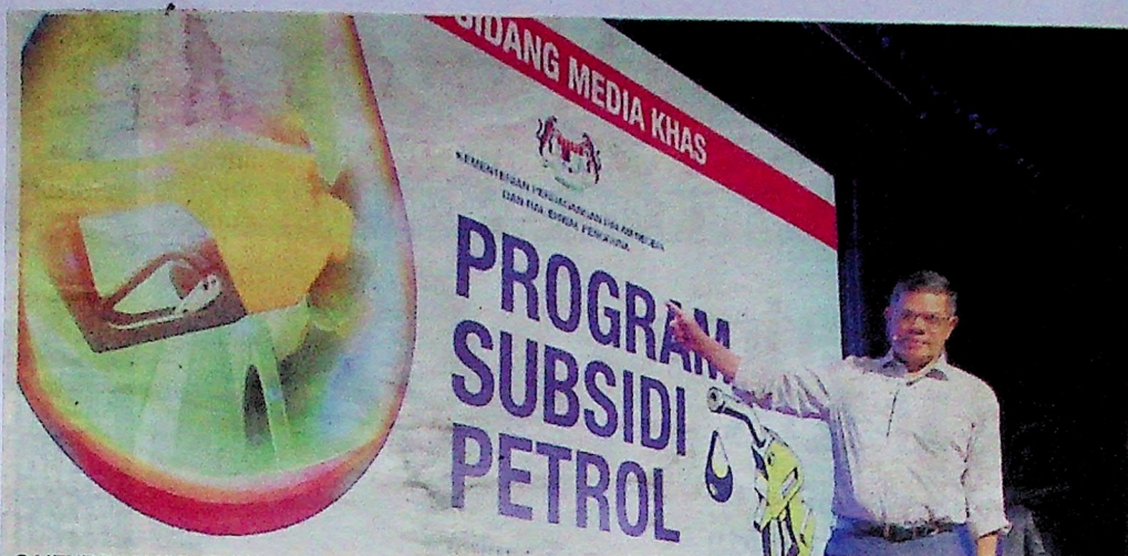
SAIFUDDIN NASUTION memberi penerangan mengenai Program Subsidi Petrol pada sidang akhbar khas di Dewan Serbaguna kementeriannya di Putrajaya semalam.