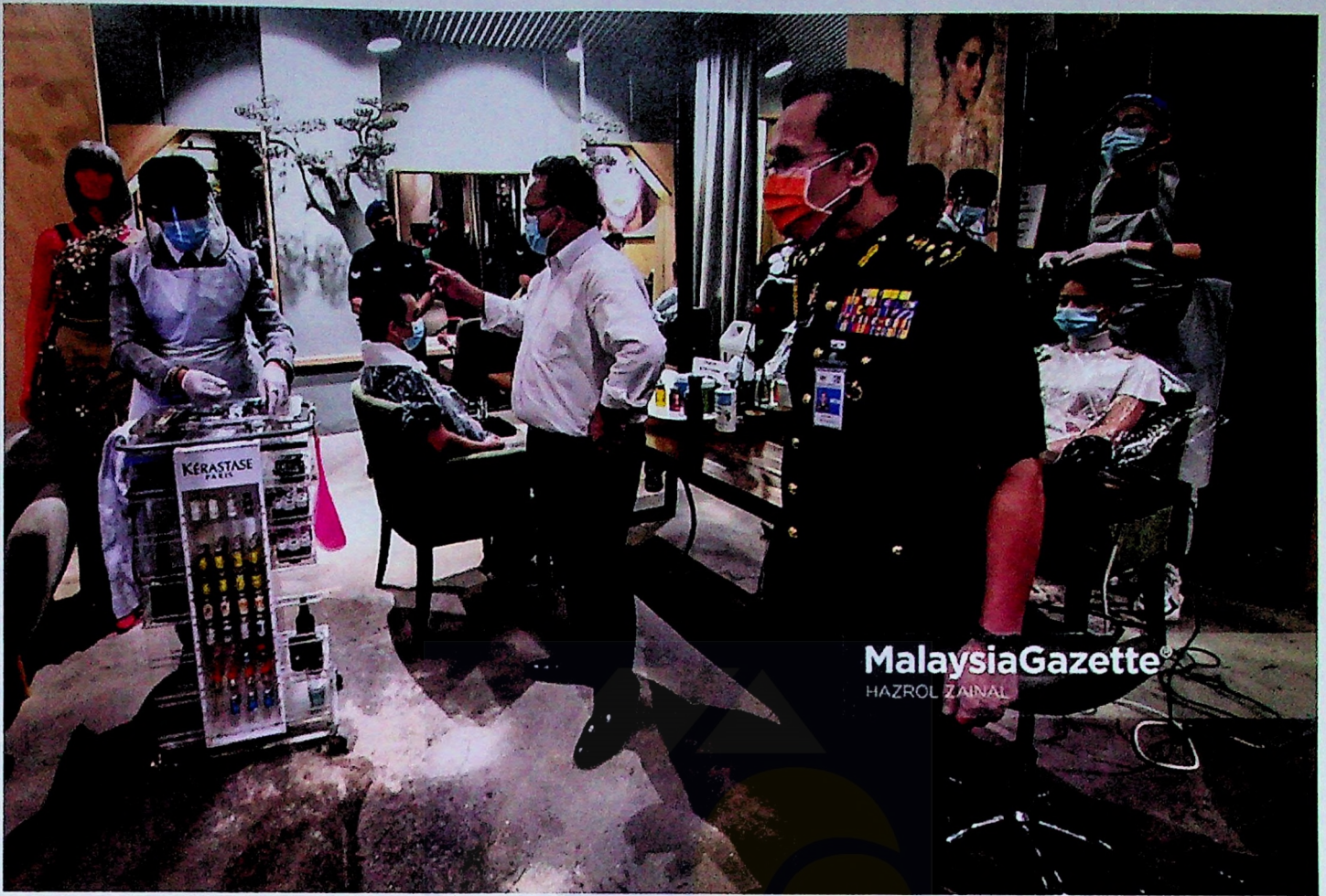
Menteri KPDNHEP, Datuk Alexander Nanta Linggi (tengah) memantau prosedur operasi standard (SOP) sub-sektor perkhidmatan gunting rambut, pendandan rambut dan kecantikan pada hari pertama Perintah Kawalan Pergerakan Pemulihan (PKPP) di Pusat Beli-Belah MyTown, Cheras, Kuala Lumpur. 10 JUN 2020.