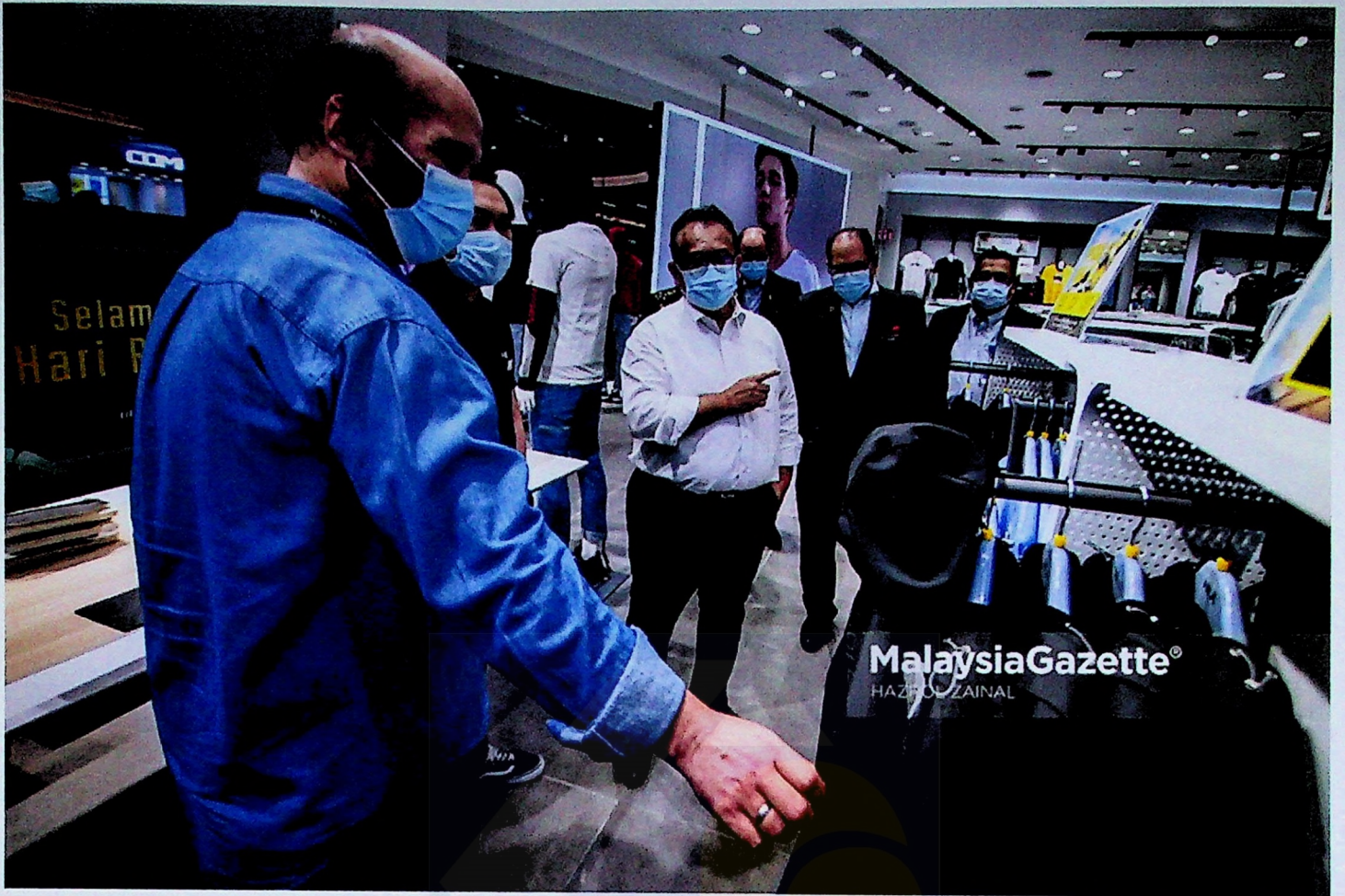
Menteri KPDNHEP, Datuk Alexander Nanta Linggi (tengah) memantau prosedur operasi standard (SOP) premis perniagaan pada hari pertama pelaksanaan Perintah Kawalan Pergerakan Pemulihan (PKPP) di Pusat Beli-Belah MyTown, Cheras, Kuala Lumpur.