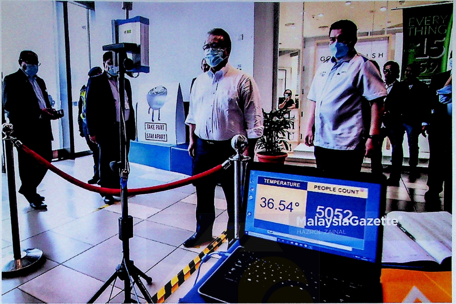
Menteri KPDNHEP, Datuk Alexander Nanta Linggi (tengah) membuat pemeriksaan suhu ketika tiba untuk memantau prosedur operasi standard (SOP) sub-sektor perkhidmatan gunting rambut, pendandan rambut dan kecantikan pada hari pertama Perintah Kawalan Pergerakan Pemulihan (PKPP) di Pusat Beli-Belah MyTown, Cheras, Kuala Lumpur.