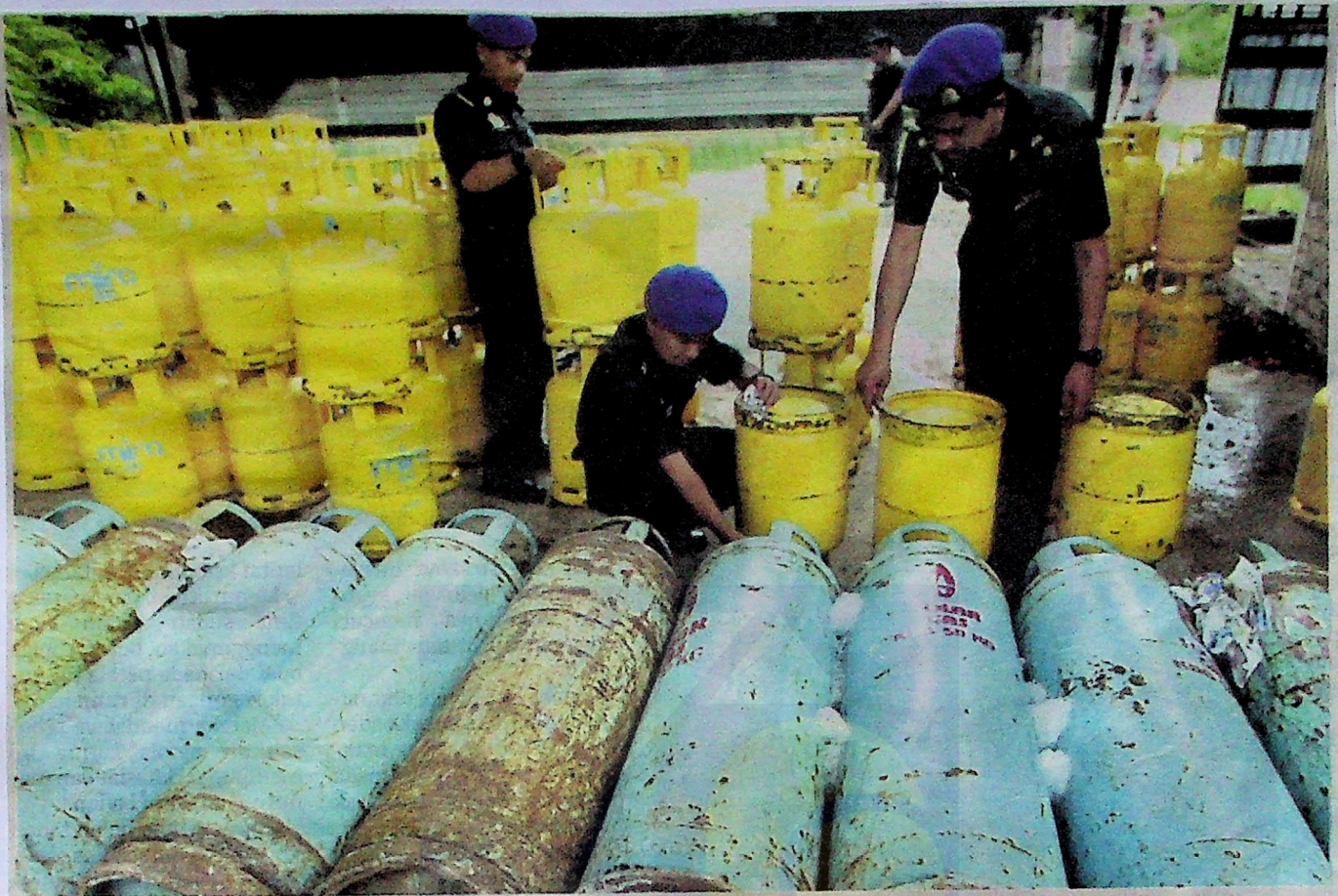
ANTARA operasi KPDNHEP membabitkan LPG subsidi yang diseleweng sindiket seluruh Malaysia terutama di Lembah Klang.