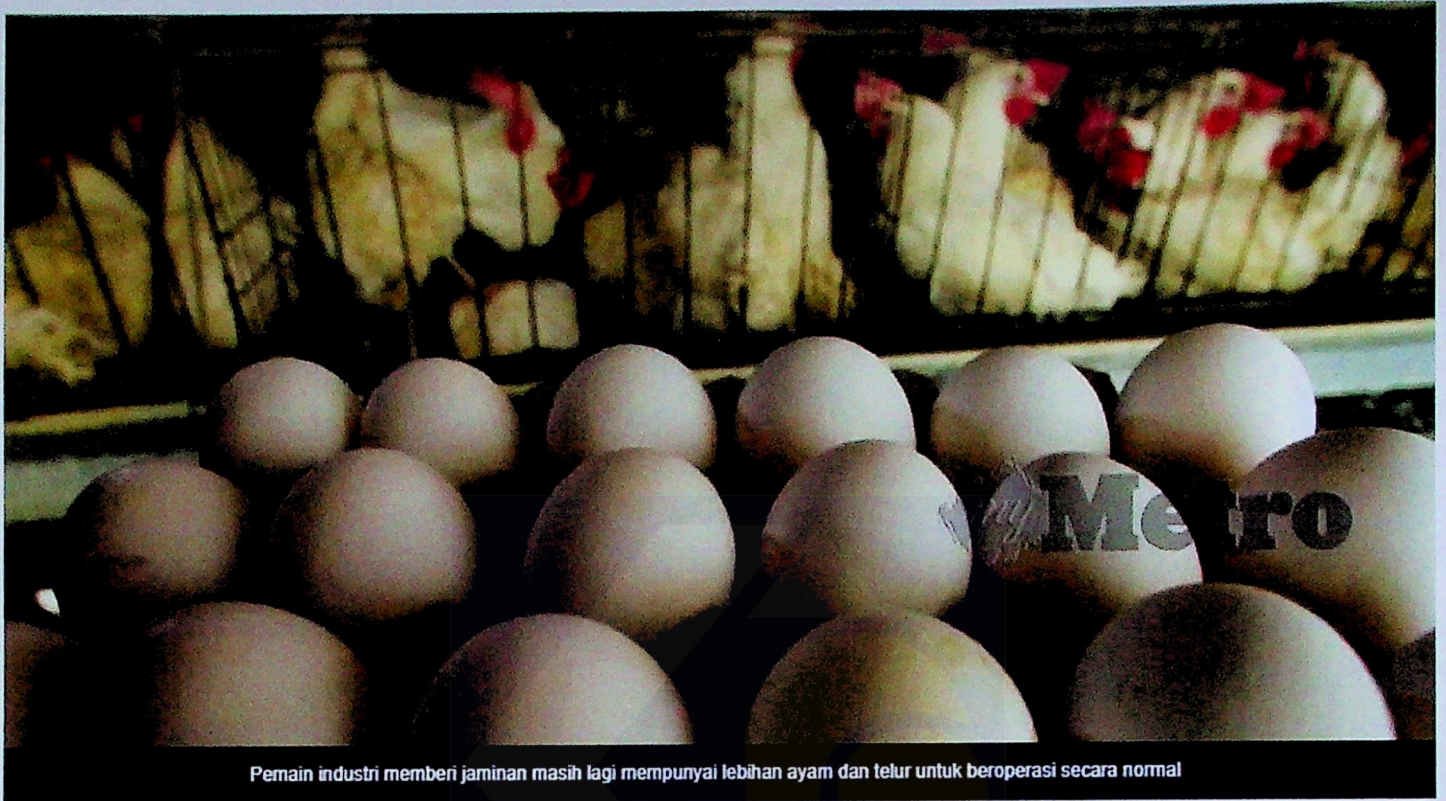
Pemain industri memberi jaminan masih lagi mempunyai lebih ayam dan telur untuk beroperasi secara normal