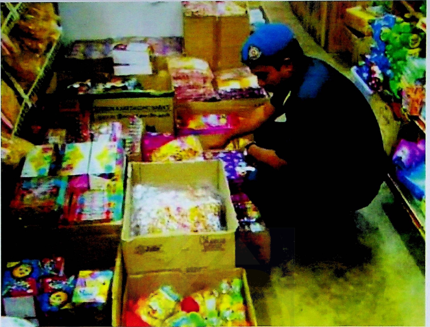
Penguatkuasa KPDNHEP Terengganu memeriksa premis bagi mengesan penjualan gula-gula 'Ghost Smoke'.