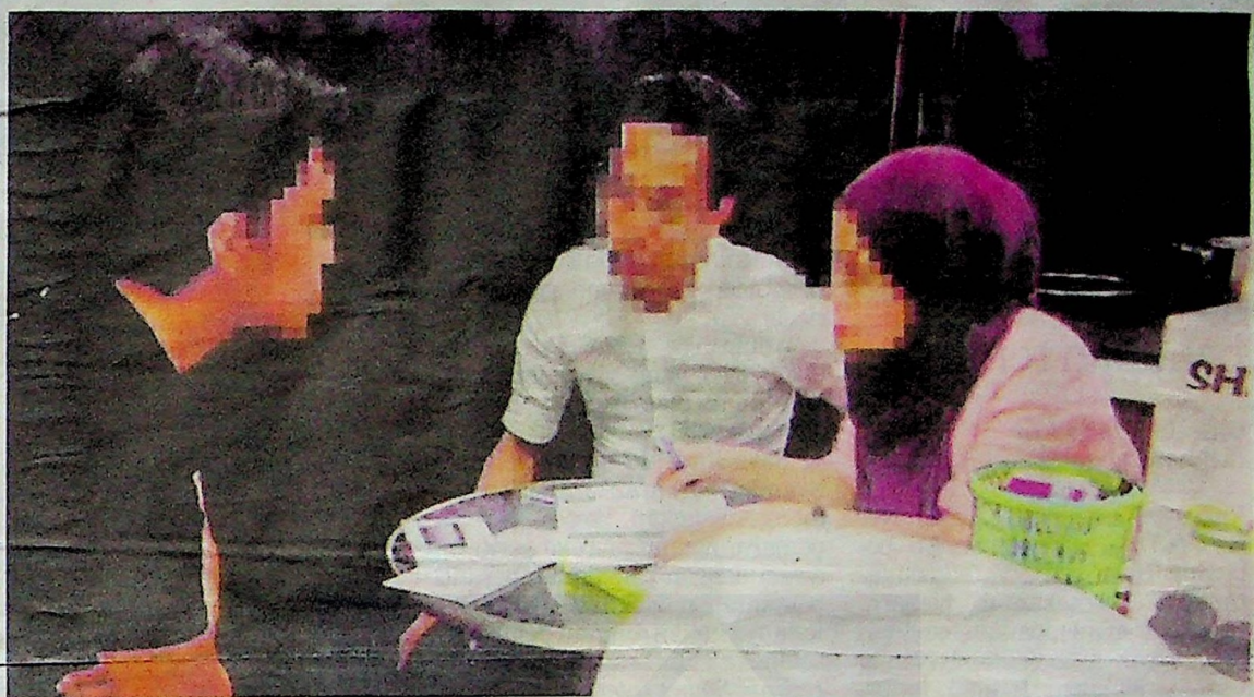
Sindiket gores dan menang memperdaya mangsa di sebuah pasar raya di Batu Caves pada 2 Julai lalu.