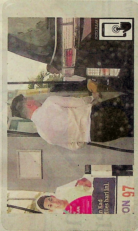
Gambar yang tular di media sosial minggu lalu.

Sebelum ini tular di media sosial beberapa keping gambar menunjukkan seorang lelaki mengisi minyak RON95 pada kenderaan dengan nombor pen-