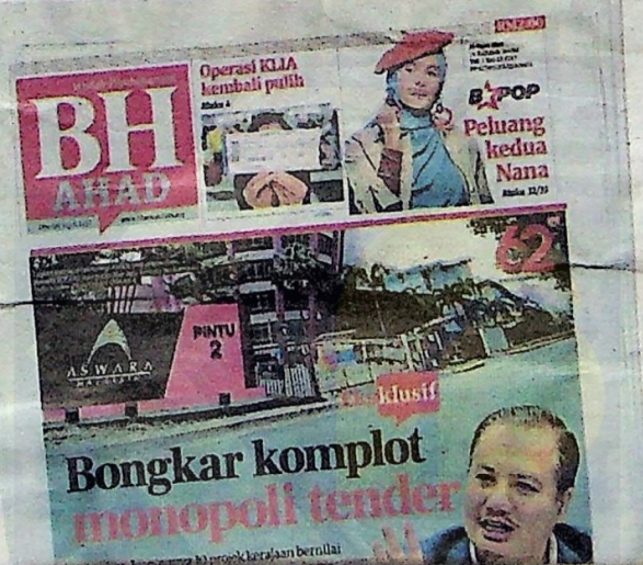
Muka depan BH semalam.

Saifuddin berkata MyCC yang ditubuhkan pada 2011 apabila Akta Persaingan 2010 diwujudkan mengambil masa dua tahun untuk merungkai kes penipuan bidaan membabitkan tender ditawarkan ASWARA kerana kes berkenaan sangat rumit.