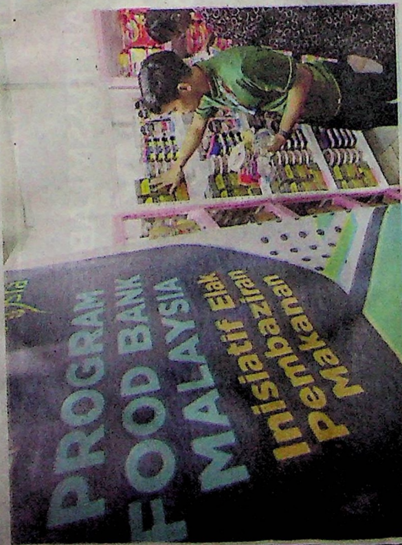
Akta khas yang dibentangkan di Dewan Rakyat akhir tahun ini, akan melindungi penaja dan penderma Program Food Bank Malaysia. (Foto Hiasan)

"Perkara ini (kenaikan harga barang) berkait rapat dengan rakyat, jadi mesti disegeterakan," katanya.