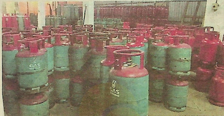
TONG LPG yang dirampas dalam serbuan di Kawasan Perindustrian Kampung Baru Balakong.

Dalam serbuan itu, sebanyak 561 LPG pelbagai saiz dan dua lori dianggarkan bernilai RM107,209 dirampas.