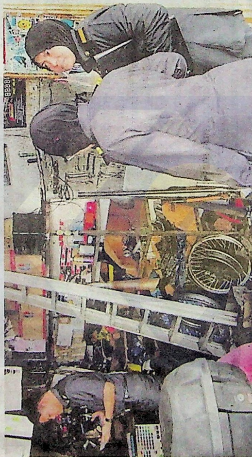
Penguatkuasa KPDNHEP Cawangan Mersing ketika melakukan pemeriksaan di bengkel-bengkel di sekitar Mersing.

"Kita juga dapati banyak bengkel masih tidak memamerkan harga perkhid-