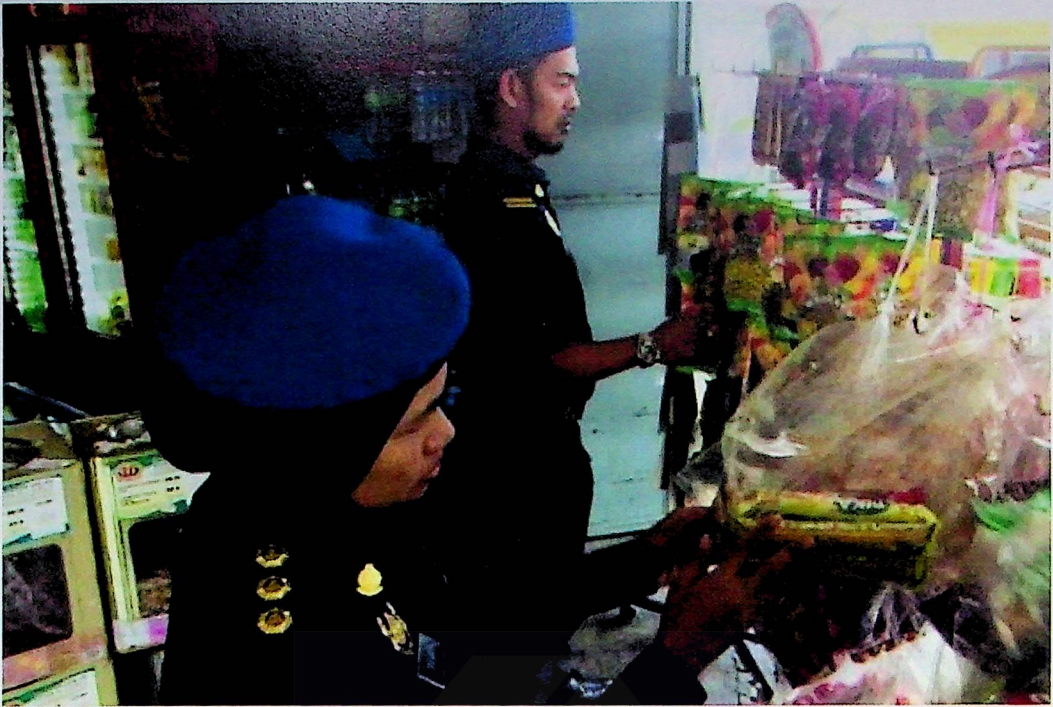
Pemeriksaan dijalankan anggota penguat kuasa KPDNHEP Jerantut di daerah ini bermula Isnin lalu.