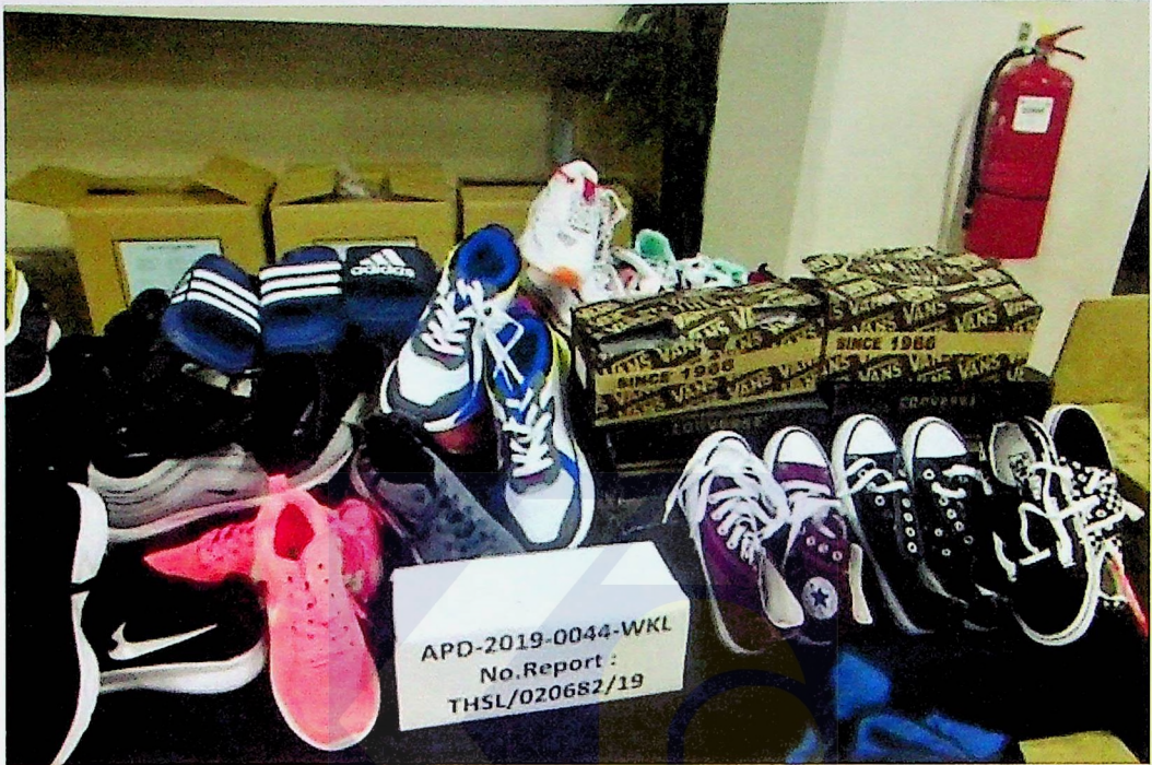
Antara barang yang dilupuskan KPDNHEP Kuala Lumpur hari ini.

Justeru, pihaknya mengingatkan individu atau syarikat supaya tidak menjual barangan tiruan bagi mengelakkan tindakan tegas dikenakan.