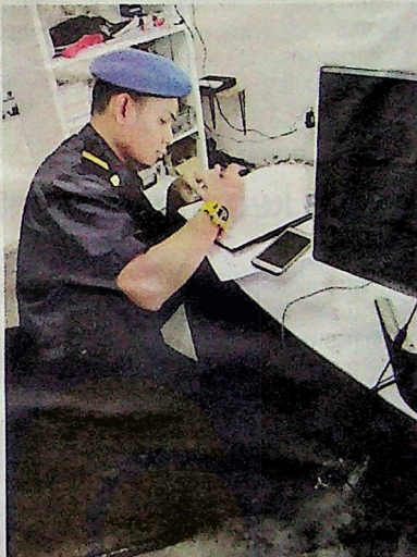
KPDNHEP mengesan penggunaan perisian salinan langgaran ciplak dalam serbuan di premis masing-masing terletak di Puchong dan Shah Alam, Selangor, baru-baru ini.

“Premis terbabit juga gagal mengemukakan lesen pemilikan perisian Autocad dan Microsoft yang digunakan. Susulan itu, kita telah menyita set komputer terbabit dengan nilai rampasan RM2,000,” katanya kepada Sinar Harian semalam.