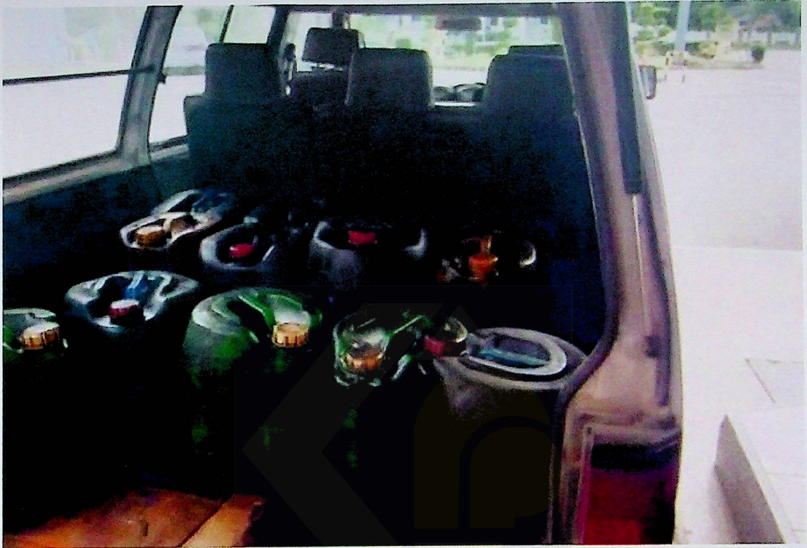
Sembilan tong 'jerry can' ditemui dalam van tersebut.

Penahanan tersebut adalah disebabkan oleh pemilik van yang tidak mempunyai permit membeli yang sah atau mendapat kebenaran daripada Pengawal Bekalan KPDNHEP.