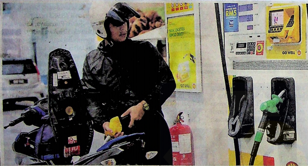
Mekanisme pelaksanaan PSP juga didakwa seolah-olah memberi tumpuan kepada golongan berpendapatan rendah sahaja.