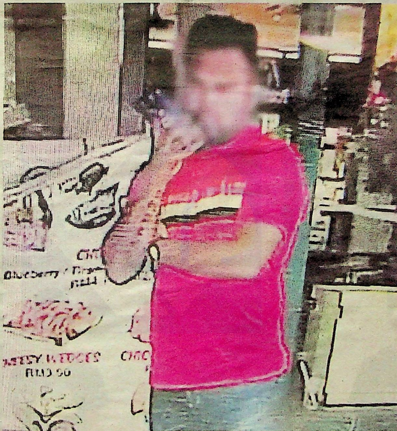
GAMBAR tular lelaki mengaku pegawai KPDNHEP yang cuba menarik kereta di R&R Seremban Lebuhraya Plus arah utara.