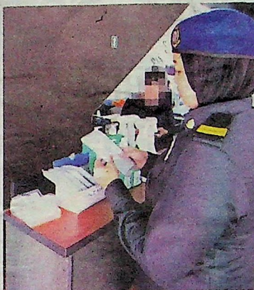
Dua premis berasingan di Kuala Pilah diserbu KPDNHEP pada Khamis lalu.

Sebaliknya, jika ia bukan perbadanan atau milikan tunggal, denda dikenakan tidak