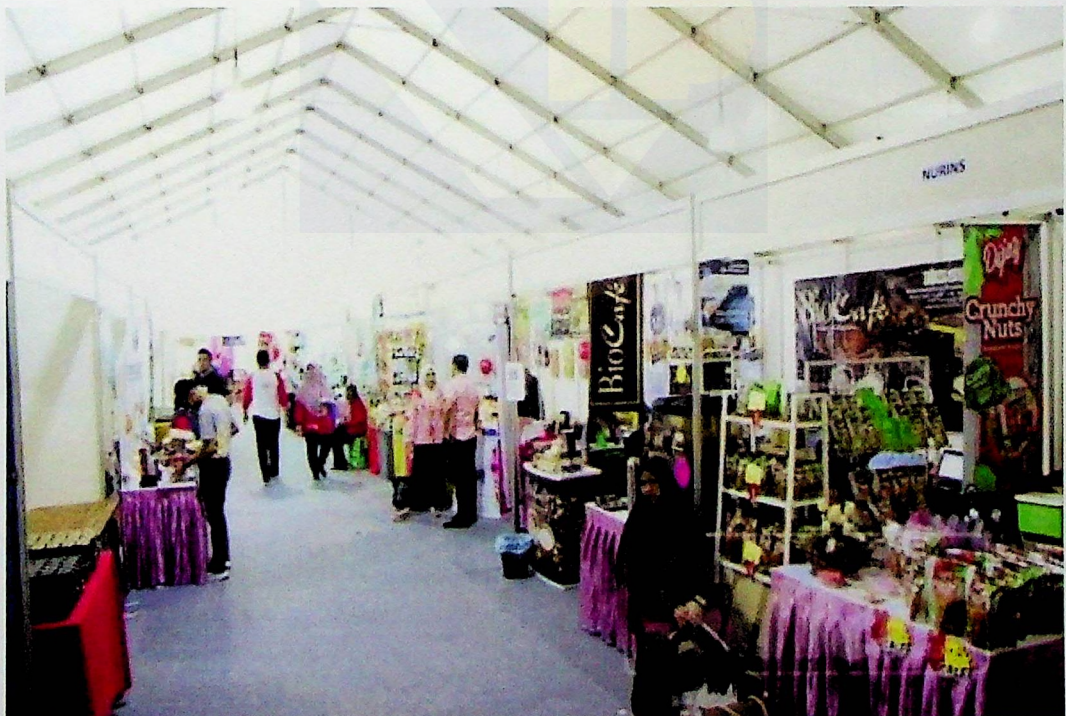
HPPK 2019 menjadi platform mempromosikan produk tempatan.