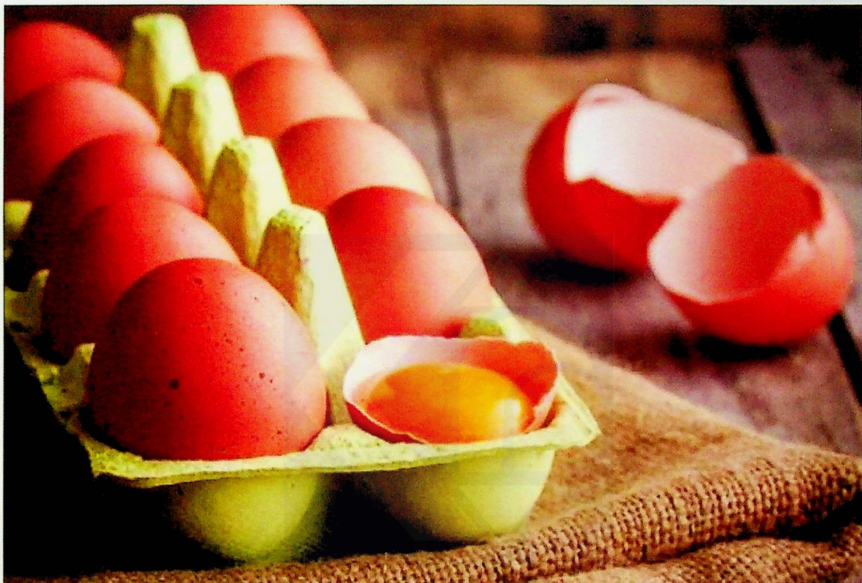
Gambar hiasan

SHAH ALAM - Jabatan Perkhidmatan Veterinar hari ini mengesahkan bahawa telur jenama 'klasik' keluaran Heap Soon Farming Sdn Bhd adalah telur ayam tulen dan bukannya diperbuat daripada plastik seperti ditularkan di media sosial.