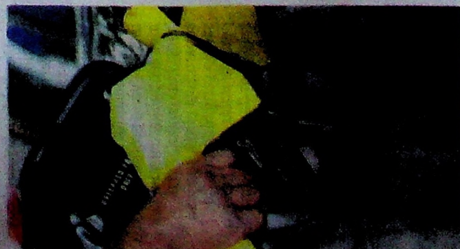
TANPA subsidi, harga petrol akan lebih tinggi mengikut harga apungan pasaran terbuka. - UTUSAN

Subsidi kerajaan dilaksanakan untuk mencapai beberapa tujuan strategik. Subsidi tidak semestinya dalam bentuk tunai atau barangan kepada rakyat. Ada subsidi baja yang disasarkan untuk petani. Ada subsidi diesel untuk nelayan. Ada Bantuan Sara