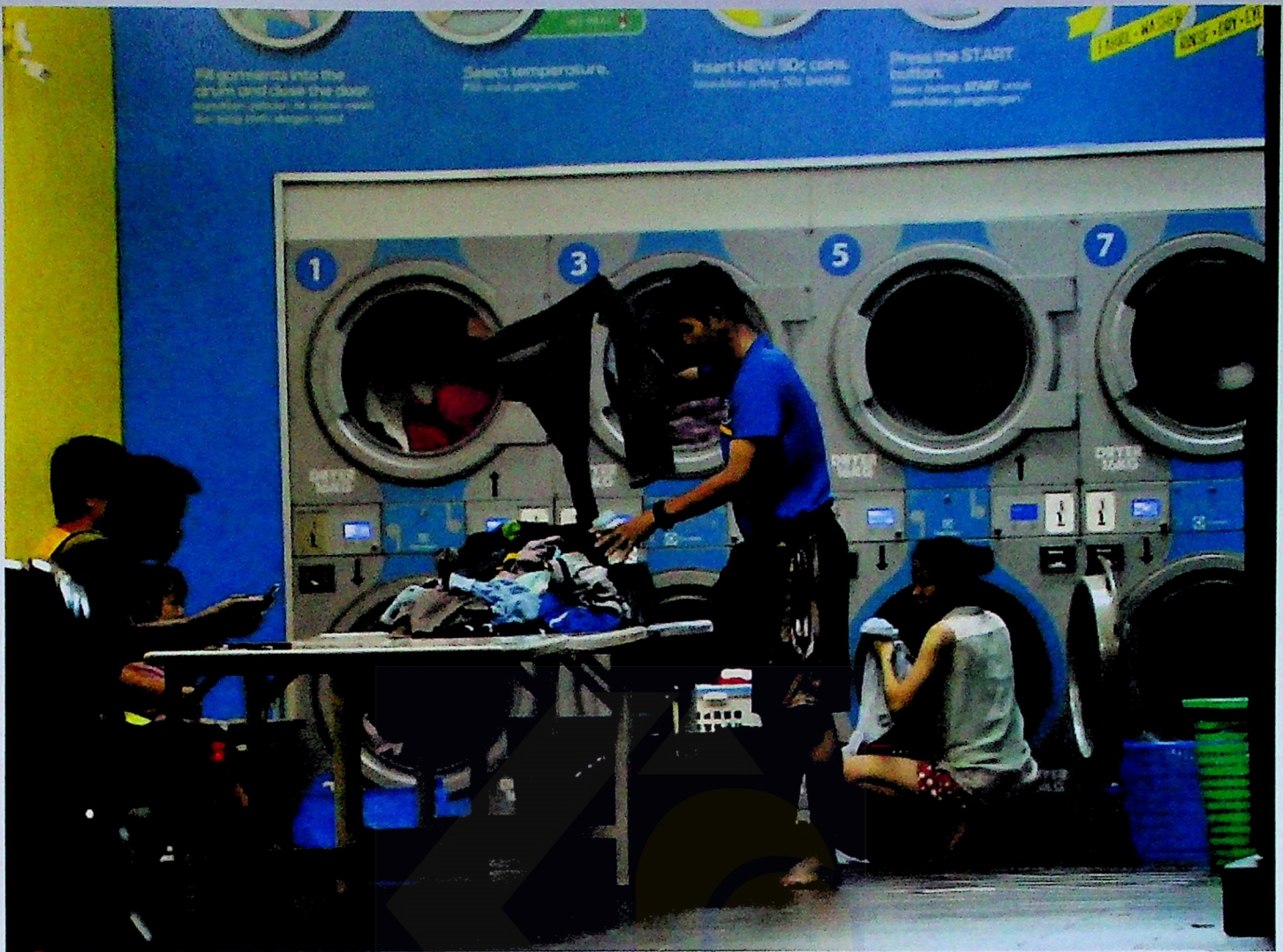
Dobi layan diri tidak boleh beroperasi sepanjang tempoh perintah kawalan pergerakan bagi mengelakkan orang ramai berkumpul.

15. Adakah penghantar barangan non-food seperti lampin padsanitari dikira sebagai essential item?