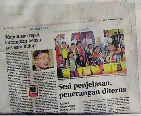
Keratan akhbar BH pada 31 Disember lalu.

Shah Alam: Pendaftaran penerima Program Subsidi Petrol bagi golongan berpendapatan 40 peratus pertengahan (M40) akan dibuka pada Mac atau April depan. Ini susulan inisiatif kerajaan untuk menyalurkan subsidi petrol kepada kumpulan itu seperti yang diumumkan oleh Menteri Kewangan, Lim Guan Eng dalam Belanjawan 2020 pada Oktober lalu. Menteri Perdagangan Dalam Negeri dan Hal Ehwal Pengguna (KPDNHEP), Datuk Seri Saifuddin-Nasution Ismail, berkata beliau dimaklumkan mengenai perkara itu dalam pertemuan dengan Guan Eng minggu lalu. Beliau berkata, data membabitkan keluarga berpendapatan 40 peratus terendah (B40) sudah