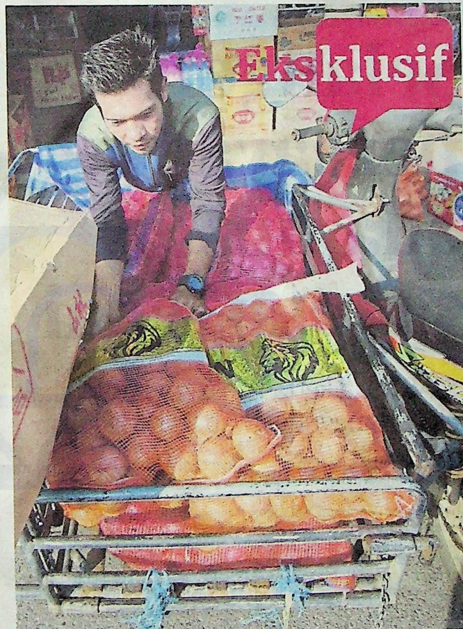
Seorang peniaga membeli bawang secara borong untuk dijual di Padang Besa, Songkhla.

Penelitian pada karung bawang yang dijual menunjukkan alamat pengimport adalah syarikat dari Malaysia. Ia dikatakan diseludup ke negara jiran dan dijual secara terbuka.